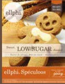
GP820 Spéculoos / Speculaas / Speculoos