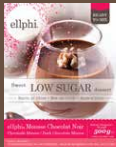
GM8060 Mousse chocolat / Chocolademousse / Dark chocolate mousse