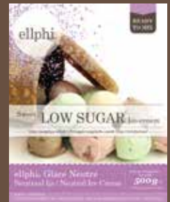
GL800/GL830/GL806 Neutre - Vanille - Chocolat Neutraal - Vanille - Chocolade Neutral - Vanilla - Chocolate