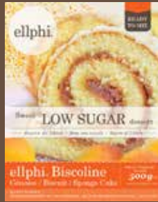
GP880 Génoise nature / Biscuit / Plain sponge cake