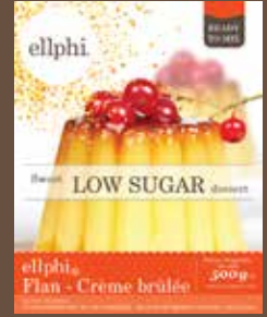
GM805 Flan caramel Crème brûlée