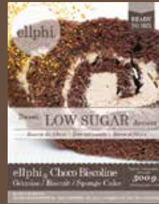
GP886 Génoise choco / Biscuit choco / Choco sponge cake