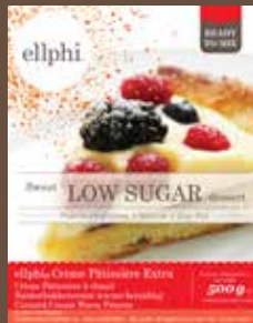
GM820 Crème pâtissière à chaud / Banketbakkersroom warme process / Custard cream warm process