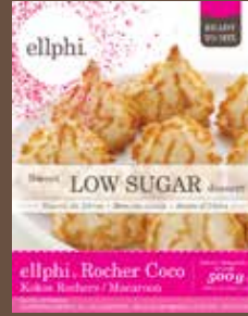
GP810 Rochers cocos / Kokosrotjes / Coconut rocks