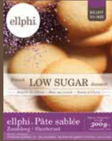
GP860 Pâte sablée / Zanddeeg / Short crust