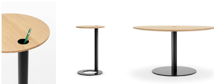
Tala mit Behältnis für Schreibgeräte: als Beistelltisch und als Rundtisch für kleine Besprechungen