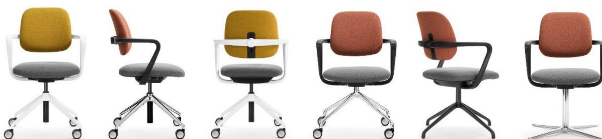
Drehstuhl Ategra mit unterschiedlichen Gestellausführungen – mit Rückenlehnenbügel in Schwarz oder Weiss