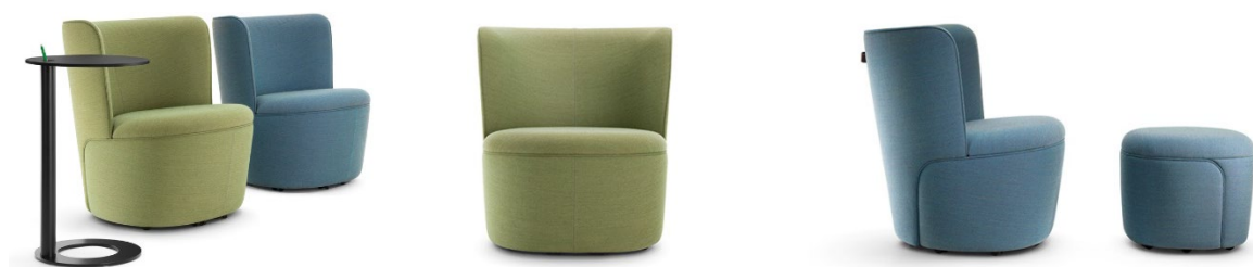
Cina Loungesessel – ergänzt durch den Beistelltisch Tala (Bild links) sowie durch den passenden Hocker (Bild rechts)