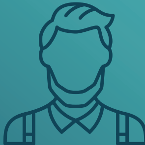
Martin B., Lebensmittelproduzent

Ich will, dass die Umstellung auf nachhaltige Verpackungen für uns einfach ist und wir rechtzeitig auf gesetzliche Vorgaben reagieren können.