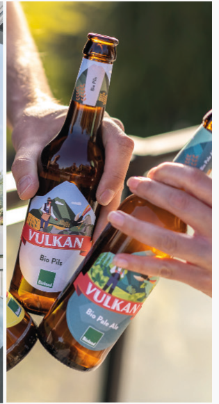
Displaystarkes Branding für hohe Aufmerksamkeit

In unserer gläsernen Brauerei in Mendig entstehen unsere charakterstarken Vulkan Bio Biere nach dem deutschen Reinheitsgebot.